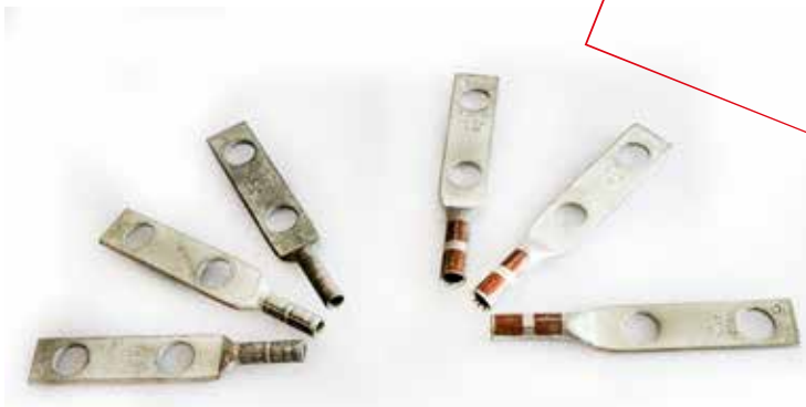
ZAPASTAS DOBLE OJILLO