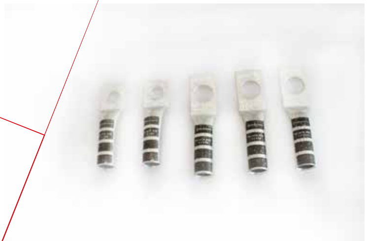
ZAPATA 1 OJILLO