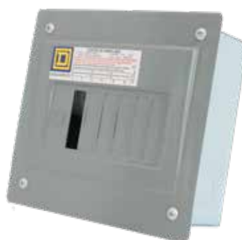
CENTRO DE CARGA