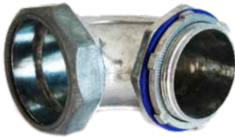
CONECTOR CURVO LICUATITE