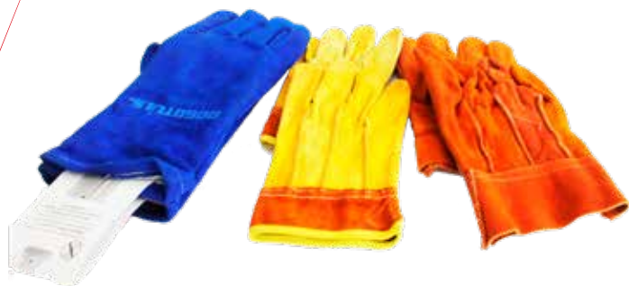
GUANTES DE SOLDADOR Y CARNASA