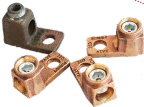
CONECTOR PARA VARILLA