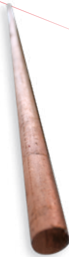
ELECTRODO PARA TIERRA