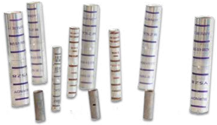
CONECTORES A TOPE