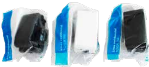
APAGADORES Y TIMBRES