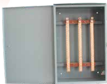
CENTRO DE CARGA 24 AMP