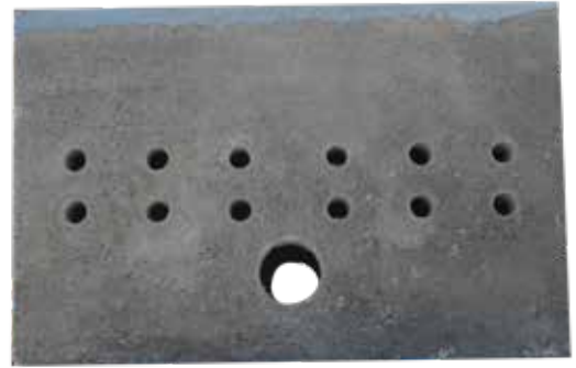
CFE- RBTB1, CFE-RBTA1, CFE-RBTB2 Y CFE-RBTA2