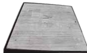
TAPA PARA REGISTRO DE ALUMBRADO