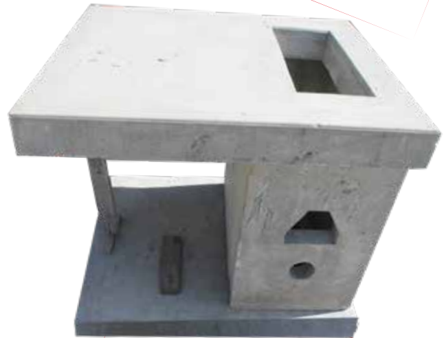
CFE-BTMRR5 Y CFE-BTMRR6