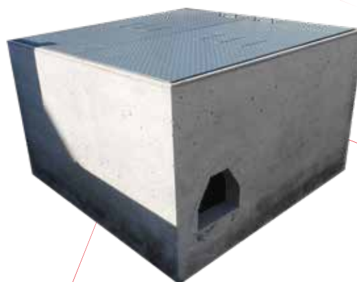
CFE-RMTB4 CON PUERTAS ABATIBLES DE LAMINA ANTIDERRAPANTE CAL- 3X16