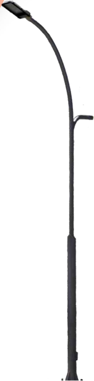
POSTE CURVO CON DOBLE BRAZO