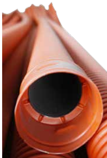
TUBO PAD 6 MTS. 1/4", 1/2" ,2",3" Y 4"