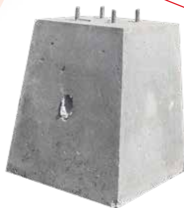
BASE DE CONCRETO 50X60X35