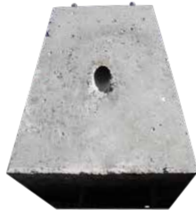
BASE DE CONCRETO 1X1.50X60