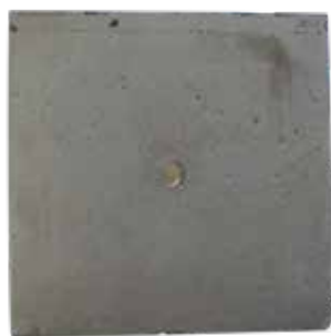
REGISTRO PARA ALUMBRADO 60X60X70