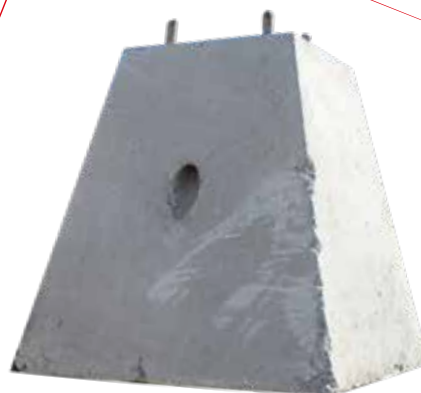
BASE DE CONCRETO 60X70X45