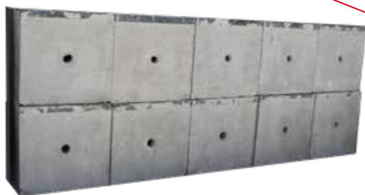
Registro alumbrado 50x60X50 con tapa.