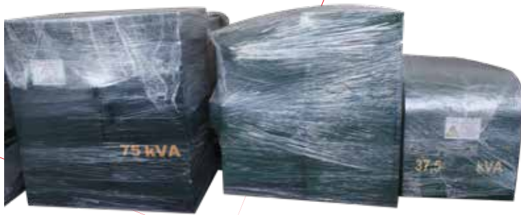
TRANSFORMADORES TIPO PEDESTAL 75KVA, 25 KVA Y 37.5 KVA