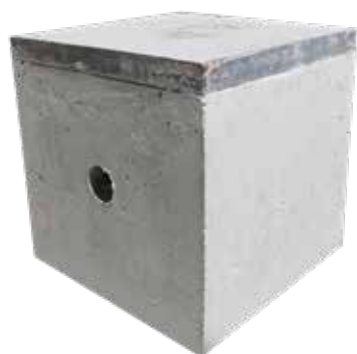
REGISTRO ALUMBRADO 60X60X60