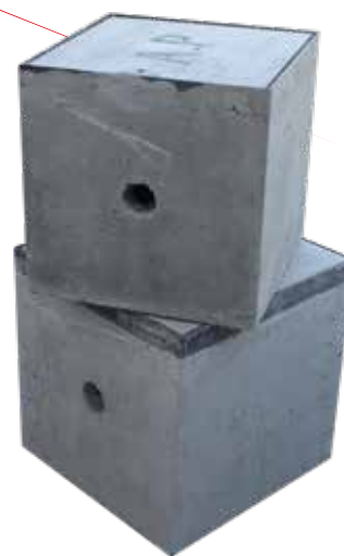
Registro para alumbrado 40X40 con tapa .