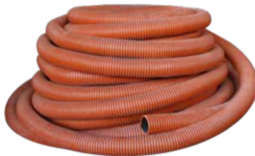
ROLLO TUBO PAD 1" 1/4", 1/2" ,2",3" Y 4"