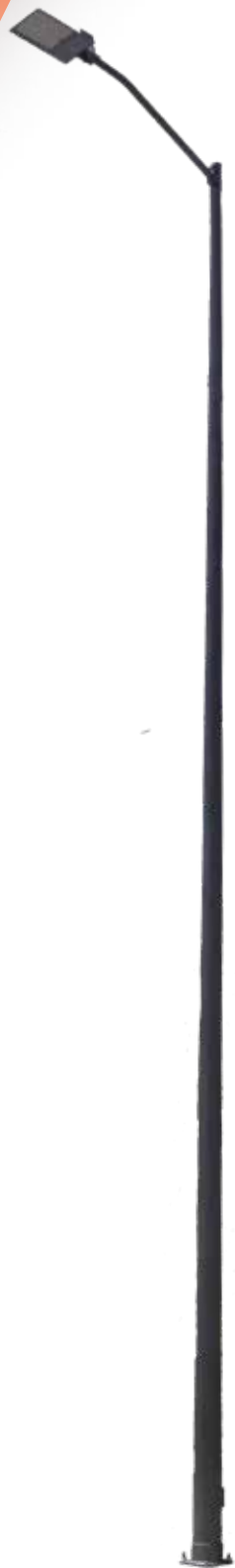
POSTE CONICO CIRCULAR