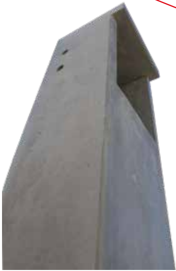
MURETE DOMICILIARIO 1 SERVICIO AÉREO Y SUBTERRANEO