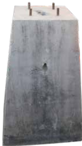
BASE DE CONCRETO 1X1X.40