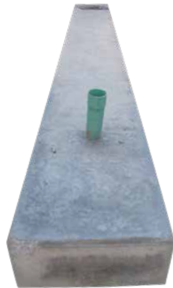
MURETE DOMICILIARIO 1 SERVICIO LISO AERÉO Y SUBTERRANEO.