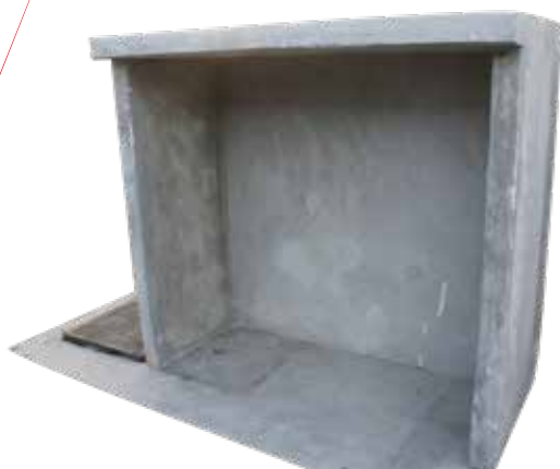
MURETE DERIVADOR J3, J4 Y J6