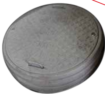
TAPA POLÍMERICA 84B ARROYO Y BANQUETA