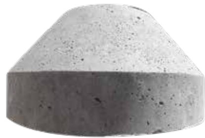
ANCLA CÓNICA C3