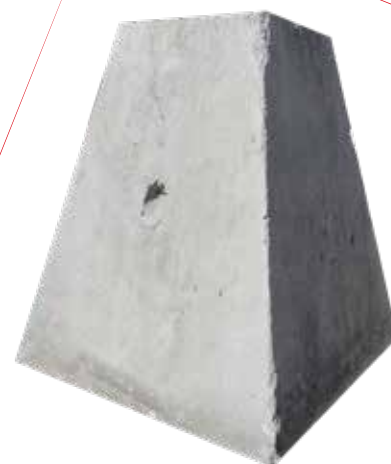
BASE DE CONCRETO 90X1.10X60