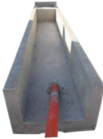
MURETE DOMICILIARIO 1 SERVICIO AERÉO Y SUBTERRANEO