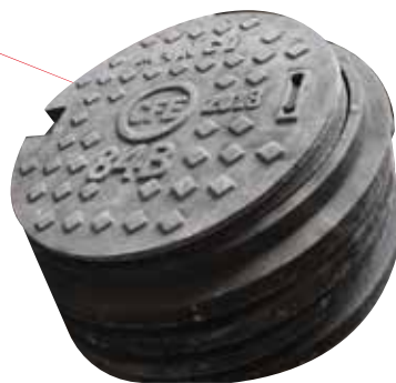
TAPA FIERRO FUNDIDO 84B ARROYO Y BANQUETA A