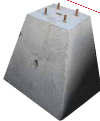
BASE DE CONCRETO 40X50X30