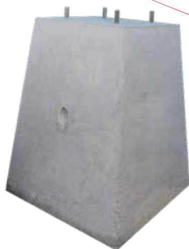
BASE DE CONCRETO 60X90X40