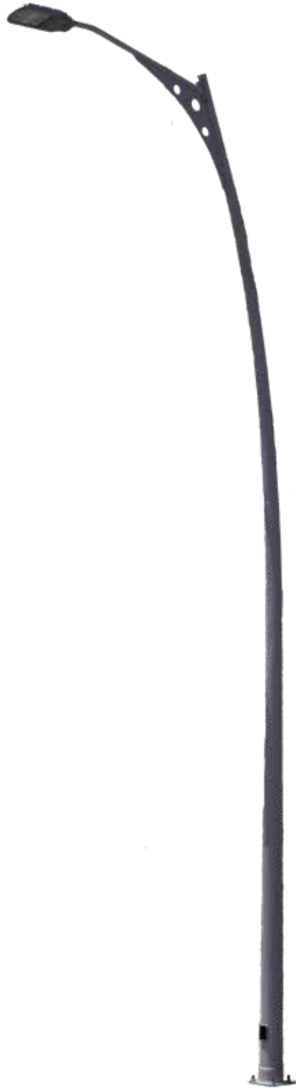
POSTE REFORMA CON ALERON