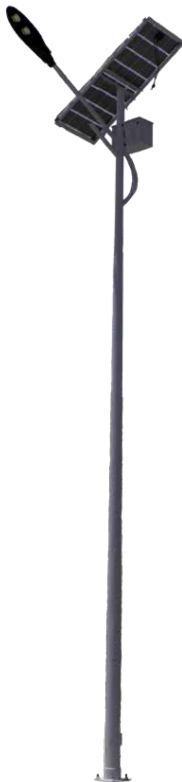
POSTE CISNE PARA PANEL SOLAR