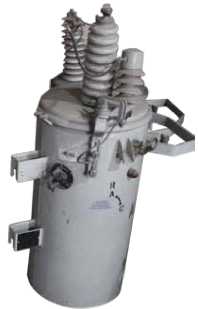
TRANSFORMADORES TIPO POSTE