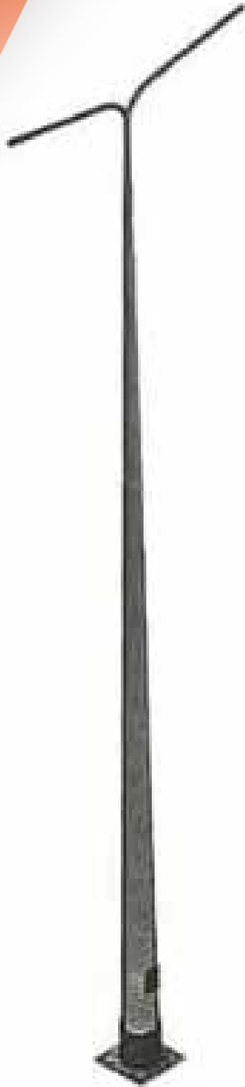
POSTE TIPO PUEBLA