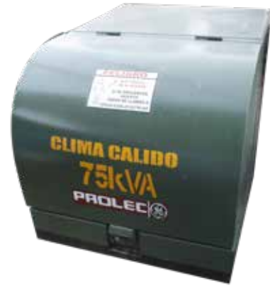
TRANSFORMADOR TIPO PEDESTAL 75 KVA